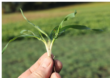
Såning 15. september: 3-4 skud pr. plante