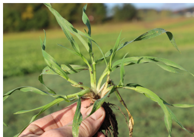
Såning 1. september: 5-8 skud pr. plante