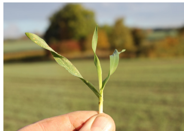
Såning 30. september: 1-2 skud pr. plante

Hyvido vinterbyg bør sås fra starten af september. Jo tidligere Hyvido-sorterne udsås, jo mere vil de buske sig og danne sideskud om efteråret. Udsædsmængden bør være mellem 130 og 200 kerner pr. m 2 afhængig af såtidspunktet. Ved såning efter 23. september bør udsædsmængden øges til 325 kerner pr. m 2